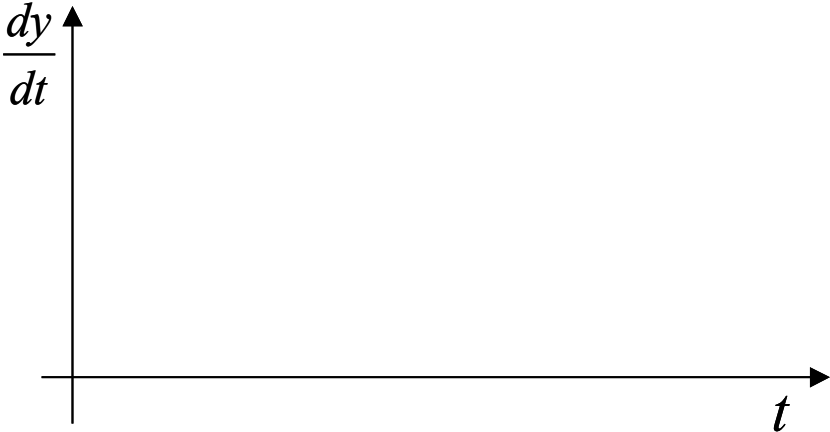
Graphique 3 : ?